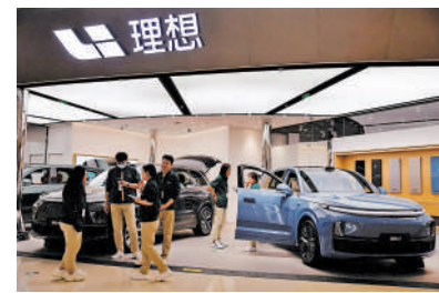
▲理想汽車銷售轉好，資金連日追貨，大摩也發表報告唱好。

大摩稱，賽力斯集團最新公布，從戰略合作夥伴華為手中，收購汽車品牌「問界」商標和專利；此舉或會改變市場競爭格局的第一步，因為「問界」品牌汽車被視為理想汽車L系列的競爭對手。賽力斯集團今次收購「問界」商標和專利，對理想汽車有利。此外，根據最近調查，理想汽車上周訂單量達1萬張，這意味著旗下L6和L7/9車型銷售回升，有望支撐7月份銷售。