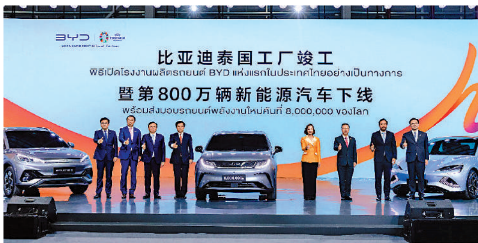
▲歷時僅16個月建設，比亞迪泰國羅勇工廠昨日舉行竣工儀式。

泰國工業協會報告指出，泰國2023年汽車銷量為77.5萬輛，按年減少8.67%；但電動車銷量逆勢上揚，按年增加超過6倍，佔整體汽車銷售市場份額接近10%，而超過80%是購買中國品牌汽車。