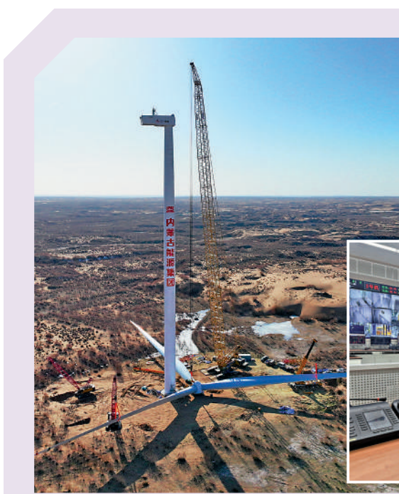
◀內蒙古風電設施發展迅速。圖為杭錦風光火儲熱生態治理項目進行風機吊裝。

由內蒙古電力集團、內蒙古能源集團合力打造的內蒙古智慧運維新電網在4月中旬成立揭牌。蒙電、蒙能透過整合優化運維服務資源，以服務自治區風光儲氫四大產業運維和碳交易、能源數字化、生態環境綜合治理為主要目標，以做好現有內蒙古能源集團新能源項目和內蒙古電力集團輸變電工程運維服務為基礎，培養人才、鍛煉隊伍、提升管理，全方位做好新能源運維服務工作。