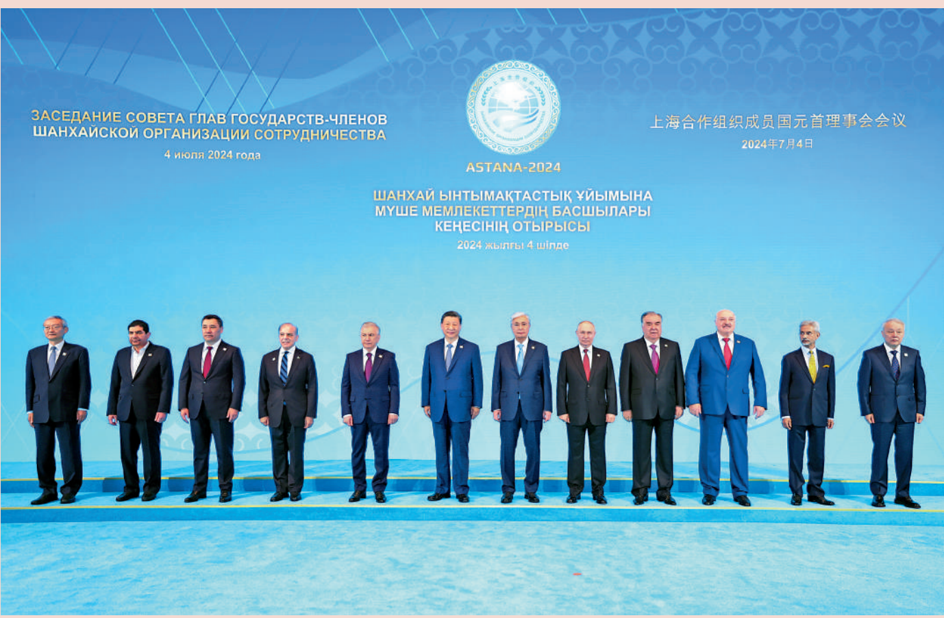
▲上海合作組織成員國元首理事會會議，2024年7月4日。

當地時間7月4日上午，國家主席習近平在阿斯塔納獨立宮出席上海合作組織成員國元首理事會第二十四次會議。習近平指出，當前，世界百年變局加速演進，人類社會又一次站在歷史的十字路口。上海合作組織站在歷史正確一邊，站在公平正義一邊，對世界至關重要。面對冷戰思維的現實威脅，我們要守住安全底線。面對「小院高牆」的現實風險，我們要維護發展權利。面對干涉分化的現實挑戰，我們要鞏固團結力量。我們要堅守初心，繼續高舉「上海精神」旗幟，守望相助，相互成就，共同把穩上海合作組織發展方向，將本組織打造成為成員國實現共同繁榮振興的可靠依託。習近平在發言中歡迎白俄羅斯首次作為成員國出席上海合作組織峰會。