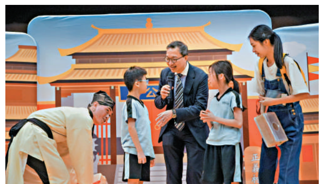
▲林定國昨日到南區官立小學，與同學們欣賞推廣法治的話劇。

「幼兒教育學教育學士(榮譽)學位課程」畢業生就業率接近九成。而「數據科學高級文憑」課程的今年首批畢業生升學率更達100%。今年首屆「護理學學士(榮譽)學位課程」共有70名畢業生；畢業生向香港護士管理局註冊並獲發有效執業證明書後，可正式從事護士專業。