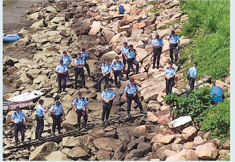
▲大批警員昨日下午在清水灣半島對開石灘地氈式搜索涉案證物。