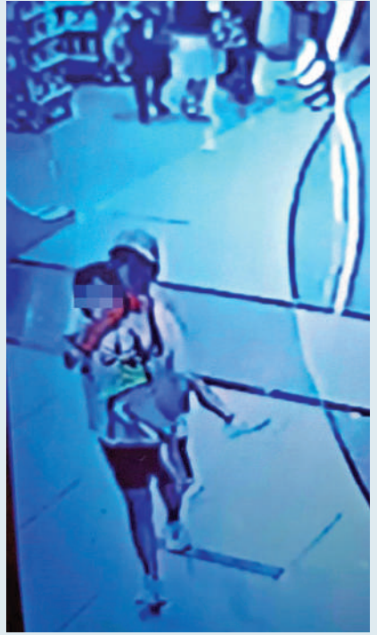
▲網上流傳閉路電視圖片，顯示一名男童被人掩嘴抱走。