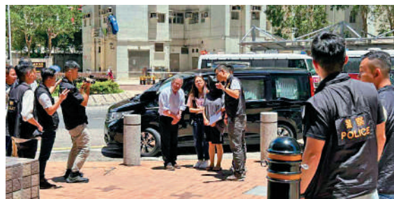
▲將軍澳綁架案，女疑犯腰纏鐵鏈，由警方押往將軍澳廣場及唐明街公園重組案情，後坐上七人車離開。