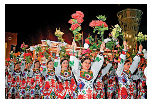
▲當地時間7月4日晚，拉赫蒙在機場為習近平舉行盛大隆重的迎賓儀式。

擴大務實合作，築牢中塔關係物質基礎。中方願同塔方推動共建「一帶一路」倡議和塔吉克斯坦「2030年前國家發展戰略」深入對接，助力彼此發展振興。雙方要探討進一步提升