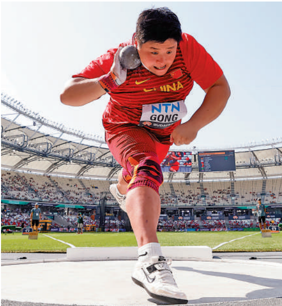
▲鞏立姣上屆東京奧運勇奪個人首枚奧運金牌。