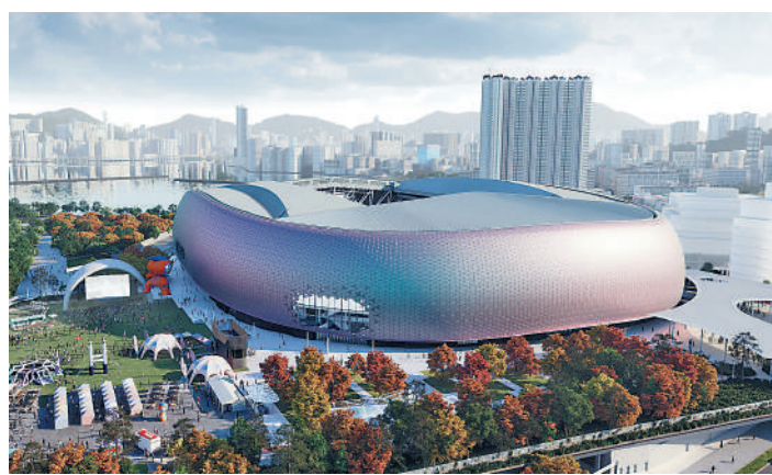
▲啟德體育園明年將舉辦不少運動盛事。

桌總上次在香港舉辦世界桌球巡迴賽認可的賽事為2022年10月於紅磡香港體育館主辦的「香港世界桌球大師賽」，該場賽事香港「一哥」傅家俊上演黑馬本色殺入決賽，與英格蘭傳奇名將奧蘇利雲合演「夢幻對決」，最終在超過8000名觀眾入場觀戰下，奧蘇利雲以6:4擊敗傅家俊奪冠。