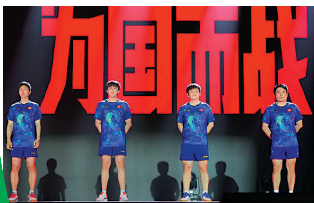
▲4名男隊成員(圖)與女隊成員先後在台上發表出征感言。

三年前，中國田徑軍團在東京大放異彩，取得2金2銀2銅戰績。展望巴黎，中國田徑隊奪金前景將面臨一定挑戰。