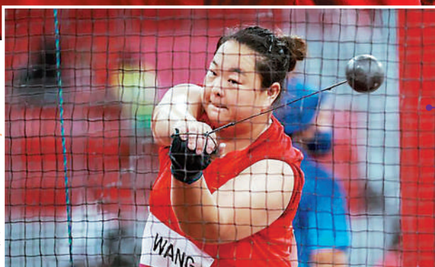
▲王崢挑戰突破東京奧運鏈球銀牌成績。