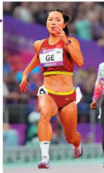
▲葛曼棋杭州亞運勇奪100米金牌，力爭巴黎奧運再衝佳績。