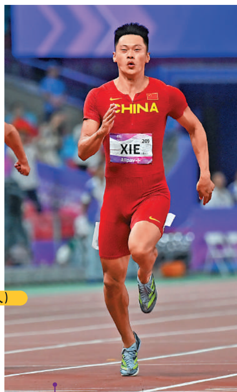
▲在蘇炳添缺席巴黎奧運後，中國男子短跑項目將剩下謝震業參與。