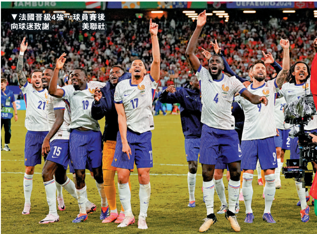
▼法國晉級4強，球員賽後向球迷致謝。