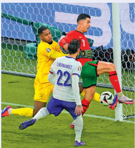
▲C朗拿度(7號)門前失機，未能在這屆歐國盃取得入球。

盼望贏得歐國盃冠軍的葡萄牙球星C朗拿度，在8強與法國對陣，雙方悶和0:0下，互射12碼輸3:5，C朗第6次歐國盃之旅正式結束。C朗11次出席國際大賽首度出現0入球，連續在國際大賽入球的紀錄戛然而止，更因