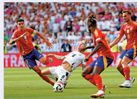
▲卻奧斯(左二)在比賽中奮戰倒地。

卻奧斯早前已在皇家馬德里結束球會生涯，他希望贏得歐國盃冠軍才正式掛靴。8強對西班牙，落後的德國完場前逼和1:1，不過西班牙加時由馬連奴入球以2:1獲勝，令這名傳球大師未能如願主場捧盃告別。卻奧斯這場