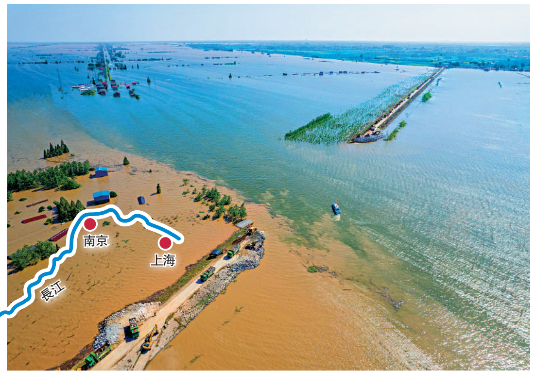
7月5日，湖南省岳陽市華容縣團洲垸洞庭湖一線堤防發生決口險情。圖為團洲垸洞庭湖大堤決堤現場。新華社