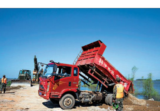
6日，搶險隊伍正在緊張地封堵決口。