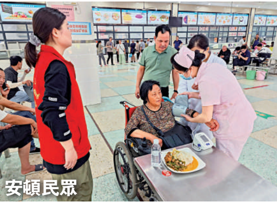
在華容縣職業中專安置點，醫務人員為轉移群眾檢查身體。

決堤發生後，來自各地的搶險救援力量迅速向團洲垸附近彙集。6日凌晨4時，通往團洲鄉的s509公路上排滿了救援車輛，除了武警、消防車輛，還有常德市支援岳陽抗洪的數十輛大卡車、中國安能救援隊的專業抽水車，甚至還有剛執行完平江搶險任務的平江縣藍天救援隊的車輛。「聽到決堤的消息後，我和同伴就來了。第一批來了10個人，兩輛車，兩艘衝鋒舟。我們遭遇洪水時華容幫了我們，現在來幫他們，互相幫。」平江縣藍天救援隊隊長黃俊光說。