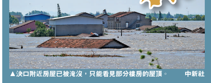
決口附近房屋已被淹沒，只能看見部分樓房的屋頂。