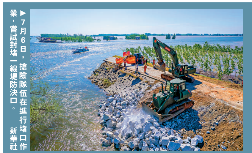
7月6日，搶險隊伍在進行堵口作業，嘗試封堵一線堤防決口。

5日晚大約七八點，附近村民接到通知要求緊急撤離。至6日1時，短短5小時，湧來的大水已上漲到團南村多處房屋房頂。目前，當地部門已安全轉移安置群眾5755人，未出現人員傷亡。當地救援力量全力搶險，料用四天時間封堵寬逾200米的一線決堤。目前省、市、縣已調配3000餘人、50餘台工程車輛、18台挖機進行清基掃障、鋪設彩條布、裝填砂袋等，築牢「第二道防線」（錢團間堤）。