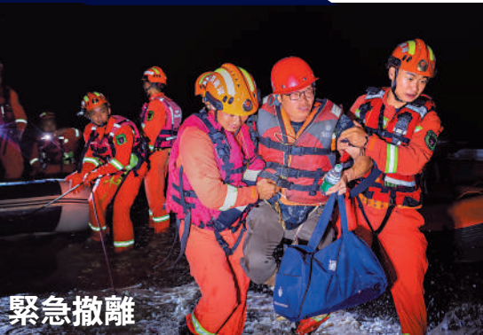
7月6日凌晨，搶險人員在湖南省岳陽市華容縣團洲垸開展救援工作。