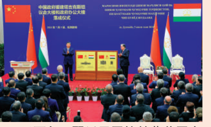
▲5日下午，習近平同拉赫蒙共同出席中方援塔議會大樓和政府大樓落成儀式。

5日，中塔元首共同出席中方援塔議會大樓和政府大樓落成儀式，為兩座大樓揭牌。該項目是中國在援外項目中首次採用聯合設計模式實施。