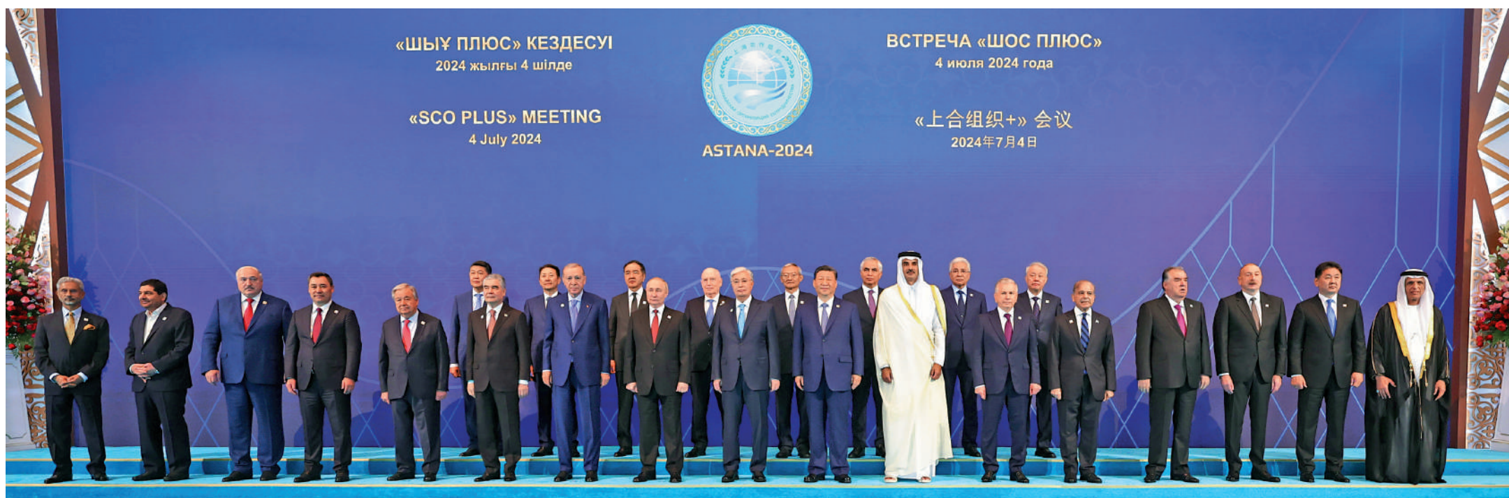
▲當地時間7月4日下午，國家主席習近平在阿斯塔納出席「上海合作組織+」阿斯塔納峰會並發表重要講話。峰會開始前，習近平出席托卡耶夫為與會代表團團長舉行的歡迎宴會並集體合影。