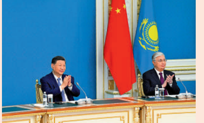
▲3日中午，習近平同托卡耶夫以視頻方式共同出席中歐跨里海直達快運開通儀式。

3日，中哈元首共同以視頻方式出席中歐跨里海直達快運開通儀式，共同下達作業指令：啟運！這是中方車輛首次以公路直達運輸方式抵達里海沿岸港口。