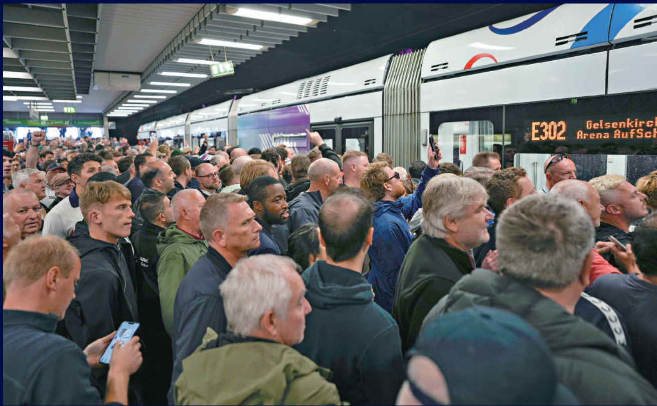
德國鐵路問題不斷，歐國盃球迷在月台上擁擠不堪。

【大公報訊】作為本屆歐國盃的贊助商，德鐵為持票球迷和持證記者都開出力度不小、頗有誠意的折扣價。據估計，歐國盃期間有超過600萬人次乘坐德鐵長途列車。許多球迷卻因為列車延誤而錯過了觀賽時機，或在賽後長時間滯留火車站。