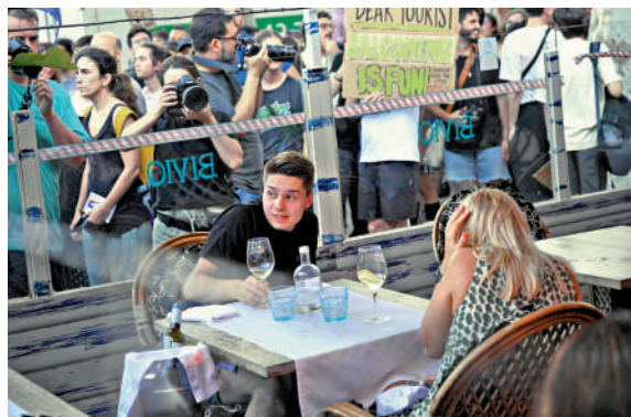
▲巴塞羅那示威者6日抗議過度旅遊，包圍遊客就餐的餐廳。法新社

【大公報訊】據法新社報道：全球第二大旅遊國家西班牙近期飽受「過度旅遊」困擾，民眾示威不斷。當地時間6日，近3000名巴塞羅那民眾走上街頭，抗議過度旅遊造成的影響。根據警方統計，約有2800人沿着巴塞羅那海濱區遊行，要求建立新的經濟模式，以減少每年數以百萬計到訪的遊客。