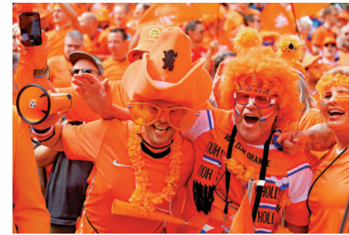
德國希望靠主辦歐國盃提振經濟，圖為2月在慕尼黑慶祝的荷蘭球迷。

另外，德國伊福研究所（Ifo）6月預測，得益於大批外國球迷和遊客前來觀賽，德國經濟有望增長10億歐元。德國頂級經濟研究機構稱，這相當於今年第二季度經濟產出的0.1%，其中酒店業和食品零售業將獲益最多。該研究所根據2006年德國主辦的世界杯的數據計算，預計歐國盃期間將額外增加60多萬外國遊客和150萬過夜遊客。