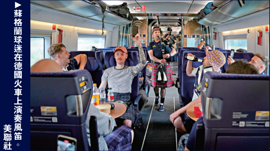
蘇格蘭球迷在德國火車上演奏風笛。

德國曾經以準時、高效和嚴謹而聞名國際，但本屆歐國盃比賽期間到訪德國的球迷和記者們卻發現，德國鐵路系統頻繁「掉鏈子」，列車延誤、取消是家常便飯；車廂悶熱擁擠、車站指示不明等，都讓外國球迷和遊客們體驗大打折扣。關於德國火車系統令人大跌眼鏡的報道，成為小組賽階段最大的場外話題之一。