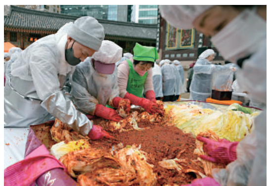
▲韓國逾千師生食物中毒，源頭疑為受污染的泡菜。資料圖片

諾如病毒（norovirus）是一種腸胃病毒，傳染性極強，可通過污染的水源、食物、物品、空氣等傳播，會引起胃痛、嘔吐、腹瀉等症狀。患者症狀通常持續1至3天，但是可能兩周後仍具有傳染性。