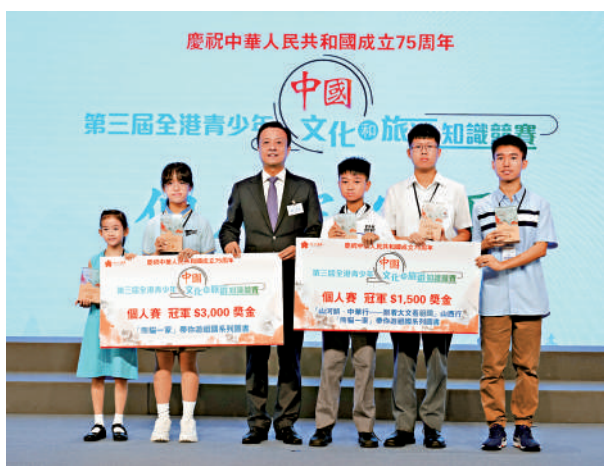
▲在「第三屆全港青少年中國文化和旅遊知識競賽」中獲得個人賽冠軍組的一眾學生。