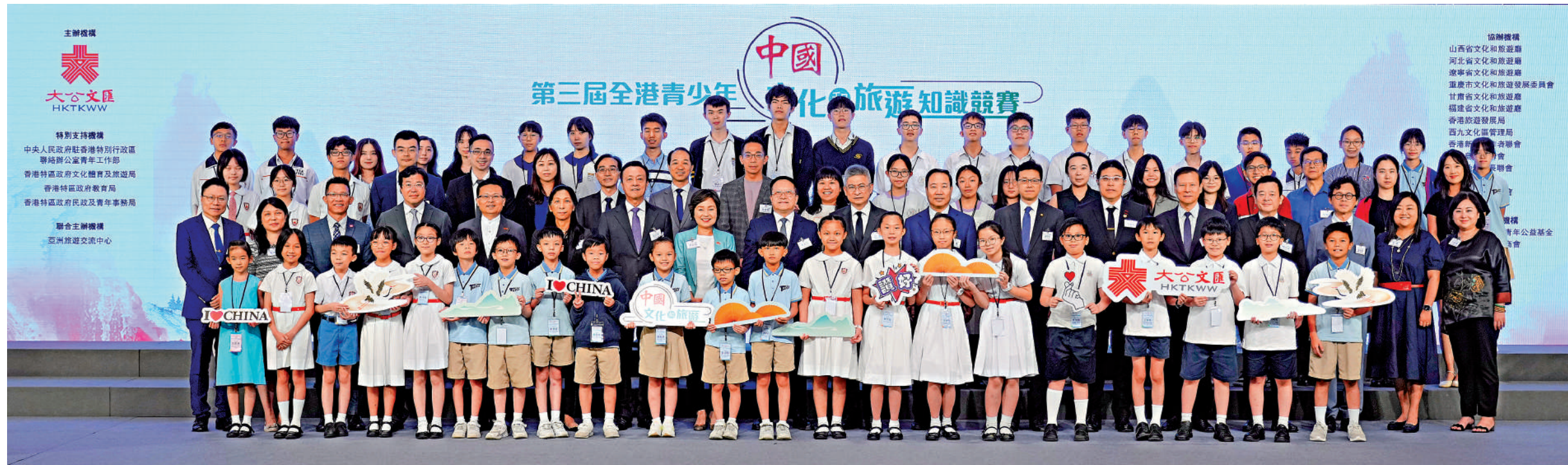
▲「第三屆全港青少年中國文化和旅遊知識競賽」頒獎禮於昨日在會展中心舉行。