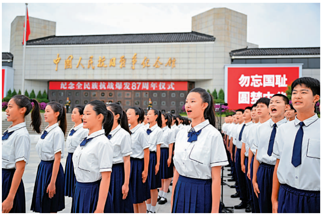
▲7月7日，首都學生代表參加在北京中國人民抗日戰爭紀念館舉行的紀念全民族抗戰爆發87周年儀式。

1937年7月7日，日軍在北平西南盧溝橋附近演習時，藉口一名士兵「失蹤」，要求進入宛平縣城搜查，遭到中國守軍第29軍嚴辭拒絕。日軍遂向中國守軍開槍射擊，又炮轟宛平城。第29軍奮起抗戰。這就是震驚中外的七七事變，又稱盧溝橋事變。七七事變是日本帝國主義全面侵華戰爭的開始，也是中華民族進行全面抗戰的起點。 人民網