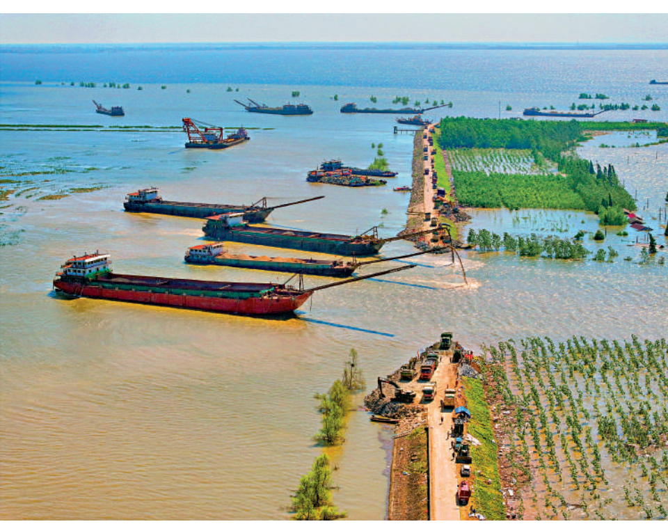
▲7月7日，在湖南省岳陽市華容縣團洲垸洞庭湖大堤決口現場，搶險隊伍在進行堵口作業。

險情發生後，由中國安能集團牽頭，地方有關部門全力做好地面和水上交通管控、搞好物料配合，以每小時四船、2000立方米的進度，加大水上拋投力度，壓實水下基礎，通過平堵和立堵結合，按照每天60至80米的速度推進，確保決口在9日12時前合龍。同時，有關部門提前科學選擇排澇泵站設置點，依照團洲垸排澇方案，隨時做好排澇準備。