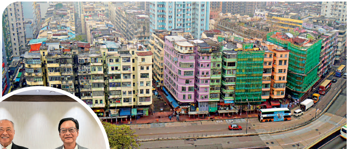
▲市建局在今明兩個財政年度，有五個項目進入業權收購階段，形容是「收購年」。 ◀市建局主席周松崗（左）表示，市建局連續兩年虧損，不涉結構性問題，料只是周期性問題。