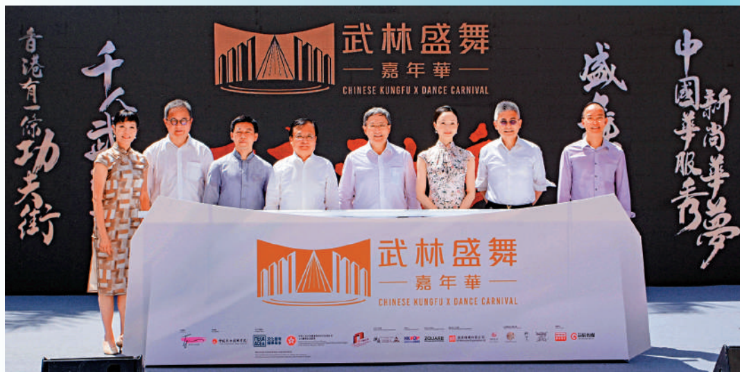
合影。眾嘉賓在「武林盛舞嘉年華」開幕儀式現場。