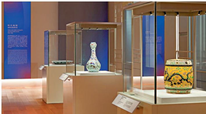
「流光彰色」故宮博物院藏明代陶瓷珍品展覽現場。

香港故宮將在展覽期間通過教育活動加深觀眾認識明代瓷器，包括舉辦講座和陶藝工作坊，令參加者不僅可以通過策展人和其他陶瓷專家了解明代御用瓷器的發展歷史和對全球的影響，還可從「流光彰色」展覽的展品中汲取靈感，繪製獨一無二的陶瓷作品。