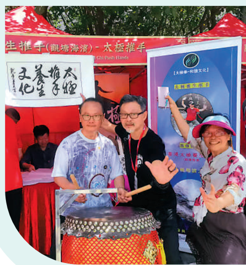
「香港有一條功夫街」上的觀塘海濱太極推手會攤位。

步入功夫街，可以感受到武術文化之廣博，各門派「掌門人」於所在攤位，向來往觀眾介紹武術文化之魅力。觀塘海濱太極推手會在攤位前放置一面鼓，隨時做好為大眾示範太極功夫的準備。協會鍾先生接受大公報記者採訪時表示，十分開心能參與這次的活動，能將太極功夫推廣給更多的人，「太極功夫蘊含天地陰陽之學，對應人生不少哲理，相信大家在學習太極之後，能對自己的生活有所啟發。」