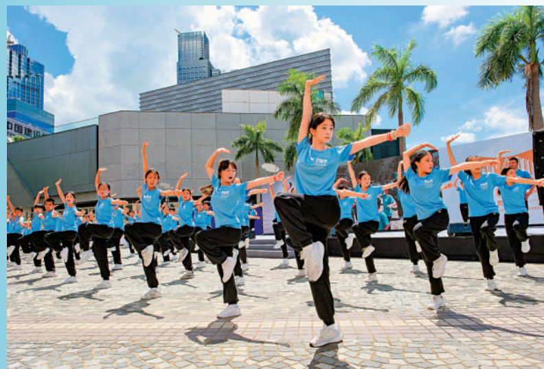
中小學生表演千人武術操展示青春面貌。

「武林盛舞嘉年華」在盛夏之際，好戲連台，包括開幕節目「千人武術操」、「香港有一條功夫街」、武術專場、「唐詩樂舞」、「粵港澳大灣區舞蹈精品展演」、功夫電影播放等，以及開幕演出「盛舞之夜」等。