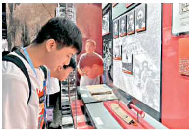
▲港生參觀淞滬抗戰紀念館。

這次交流計劃活動安排，既有充滿家國情懷的愛國主題教育，也有探尋科技發展的企業參訪，並加入「做一天上海人」環節。10日，千名滬港兩地的青年人齊聚上海交通大學霍英東體育中心舉行分享活動。