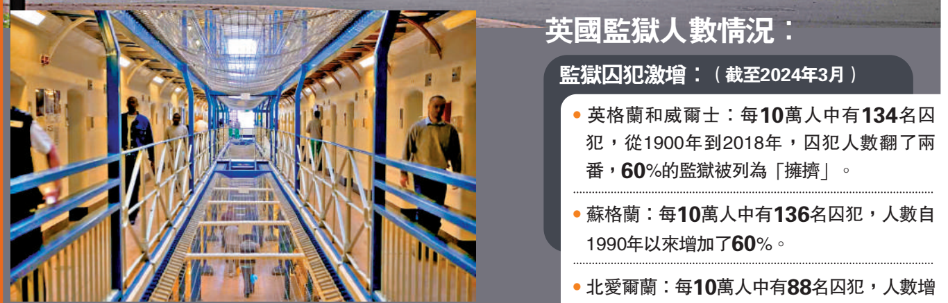
為患。英國監獄內部監獄人滿。