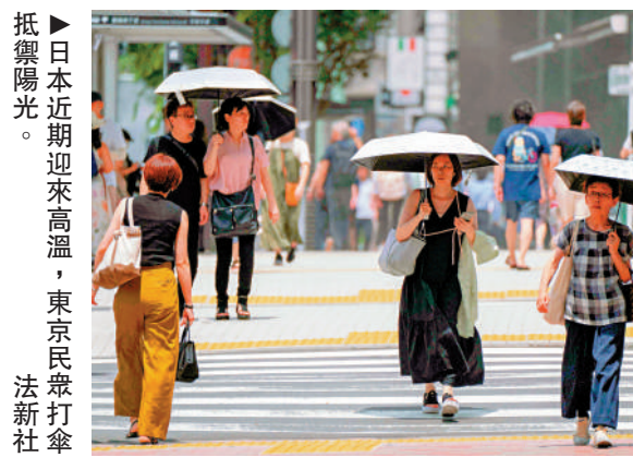
抵禦陽光。日本近期迎來高溫，東京民眾打傘。

《朝日新聞》指出，即使各地出現極端高溫，有近六成的民眾完全不開冷氣，或除了無法忍受的情況外少開冷氣，其中大部分原因是受到通貨膨脹影響，電價高漲，民眾擔心電費過高。日本高溫也造成其他災害，包括不少住宅的玻璃熱到碎裂，有維修公司表示，7月開始每天都會接到約100件相關玻璃維修案件。日本氣象廳向全國47個都道府縣中的26個發布了中暑警報，呼籲人們不到萬不得已不要外出，白天和晚上都要開冷氣，並多喝水。