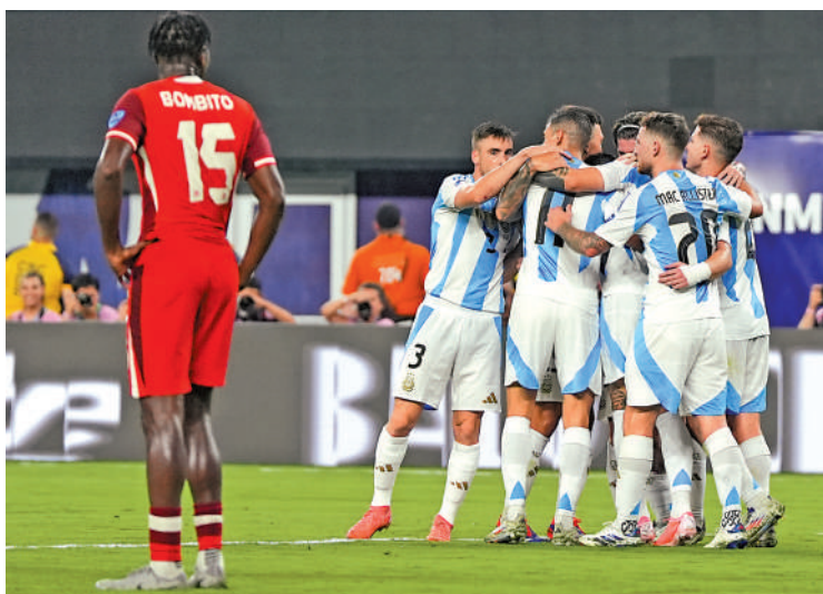
▲阿根廷勝出後，球員擁抱慶祝。

【大公報訊】據每日郵報報道：美洲盃昨早上演4強戰，前者憑藉祖利安艾華利斯和美斯各建一功，以2：0輕取加拿大晉級。取得今屆賽事首個入球的美斯，打破不少紀錄，他將繼21年美洲盃、22年世界盃奪冠後，向國際大賽3連霸進發。