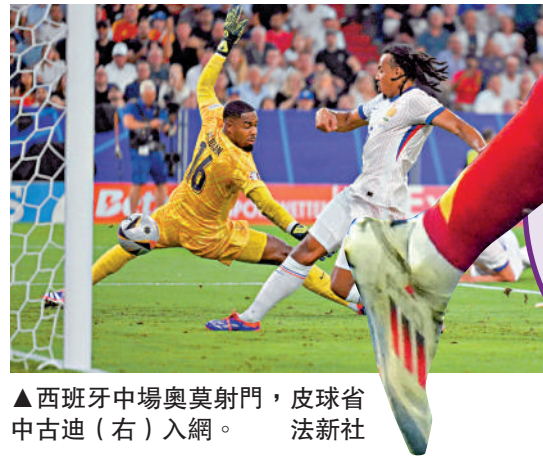
▲西班牙中場奧莫射門，皮球省中古迪（右）入網。

西班牙主帥富安迪賽後大讚耶馬爾，表示他目前表現，足夠預示他有條件成為足球界的傳奇，這名教練稱會想辦法協助對方進步及成長。耶馬將於決賽前一日（13日）迎來17歲生日，如果耶馬協助西班牙奪冠，就會成為歐國盃史上最年輕冠軍，轟動程度將可媲美比利17歲帶領巴西贏世界盃冠軍。