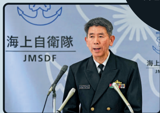
海自最高長官、幕僚長酒井良或將引咎辭職。

申醜聞導致自衛隊信譽受損，民眾對增加防衛費更加不滿。針對自衛隊的調查還擴展至防衛省官僚。據報道，一些防衛省官員被指控「多次對下屬發表威脅言論」。