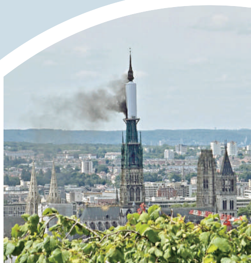
▲魯昂聖母大教堂11日失火，教堂尖塔冒出濃煙。

【大公報訊】綜合美聯社、路透社報道：當地時間11日上午，法國西北部城市魯昂的聖母大教堂尖塔失火。當天下午，火情已得到控制，沒有人員傷亡的報告。魯昂聖母大教堂的尖塔高151米，是法國最高的教堂尖塔。印象派畫家莫奈曾以該教堂為主題創作多幅名作，令其聲名大噪。