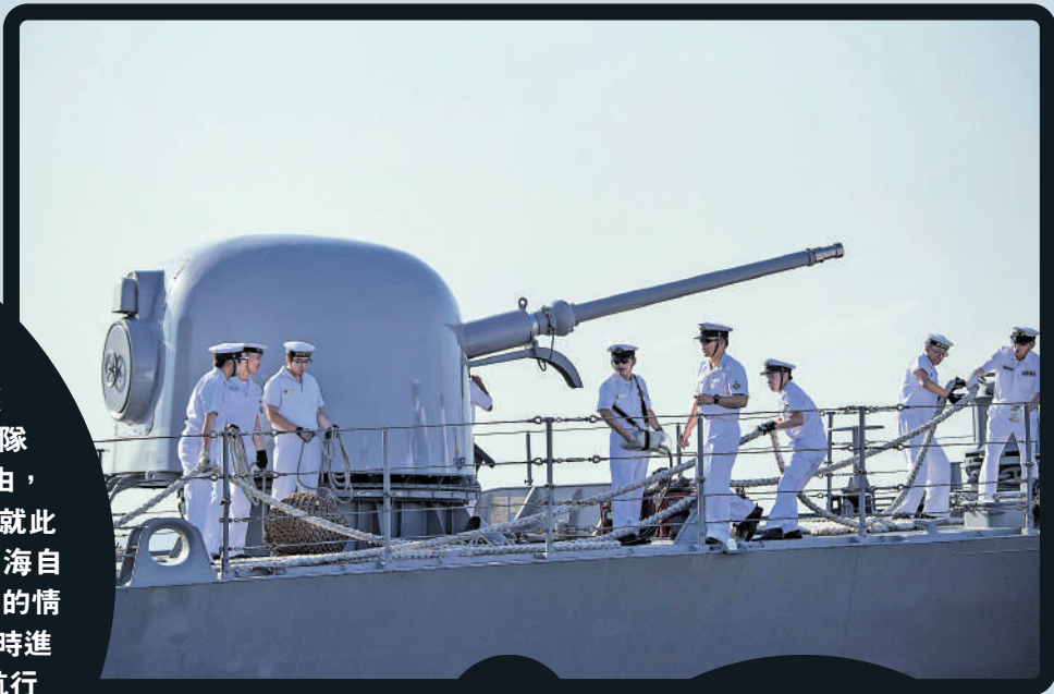
海上自衛隊涉嫌非法處理機密信息和冒領補貼。資料圖片