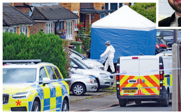
▲英國警方10日在兇案現場調查。

刺殺女王伊麗莎白二世。英國內政部發言人稱，今年已發起徵集證據的行動，以研究是否應對十字弓實施進一步管制。