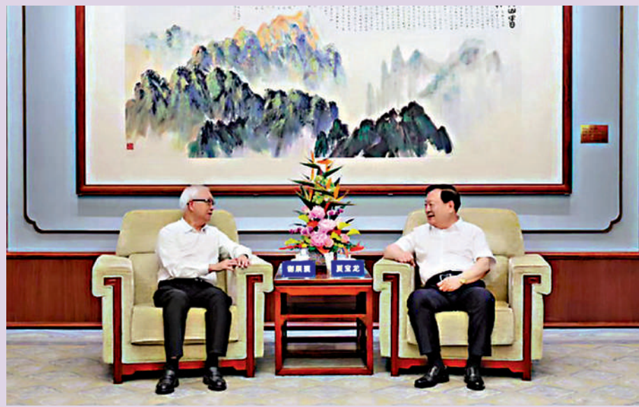
◀ 7月11日下午，國務院港澳事務辦公室主任夏寶龍在北京會見香港特區政府環境及生態局局長謝展寰一行。