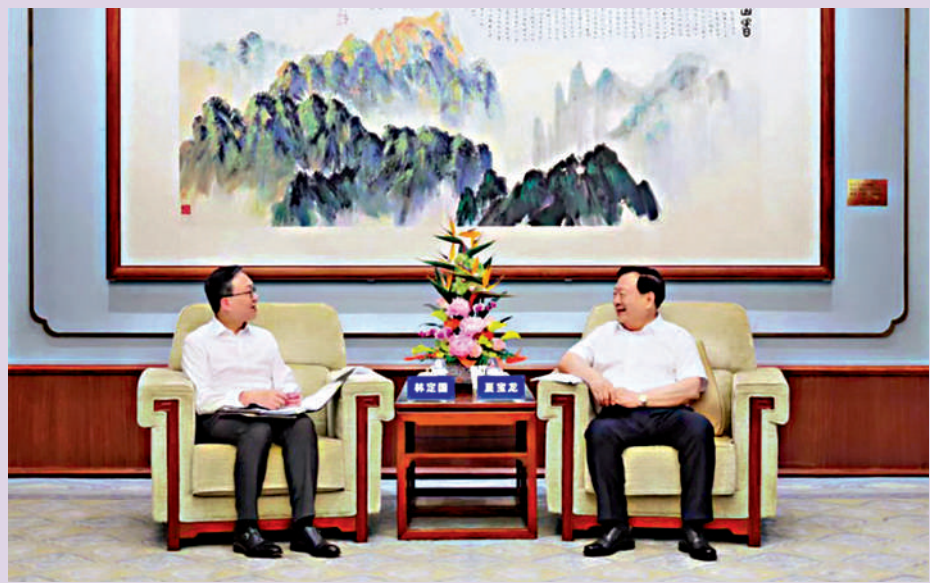
▶ 7月11日下午，國務院港澳事務辦公室主任夏寶龍在北京會見香港特區政府律政司司長林定國一行。