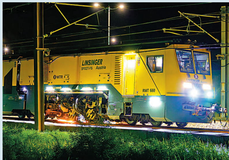
▲鐵路銹磨車正駛往機場快綫，為沿途鐵路進行銹磨。