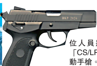
◀ 刑事單位人員將會配備「CS/LP5」半自動手槍。