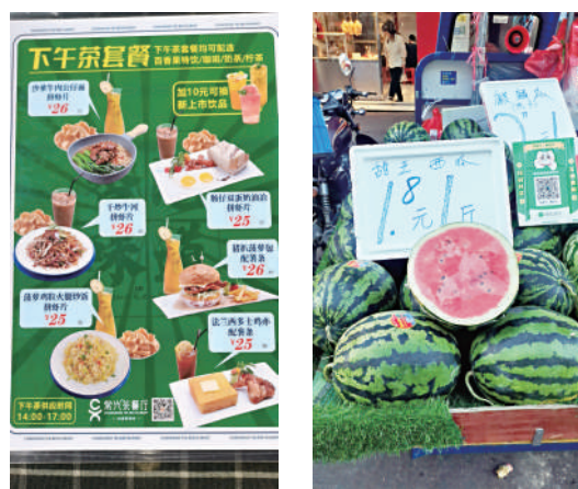
▲惠州物價比香港便宜，黃伯不用「一餐當兩餐食」。