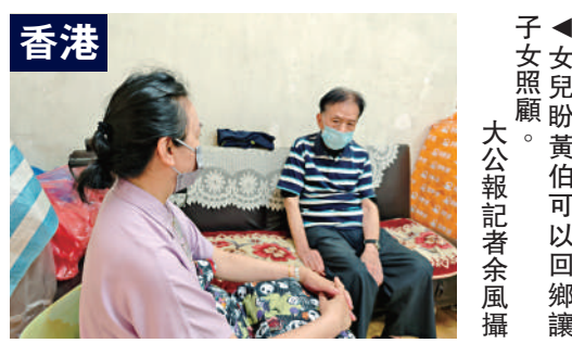
香港 ▲女兒盼黃伯可以回鄉讓子女照顧。