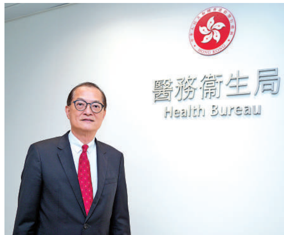
醫務衛生局 Health Bureau

▶盧寵茂表示，正從培訓本地人手及引入海外人才兩方面，解決醫護人手短缺問題。