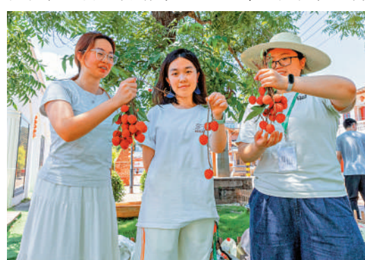
▲莆田因盛產荔枝而別稱「荔城」，紅彤彤的荔枝讓人垂涎欲滴。

在500年以上的古荔枝樹有30餘株，有10株在雙福村，而且樹齡都超過700年，雙福村是莆田古荔枝資源的主要集中地之一。