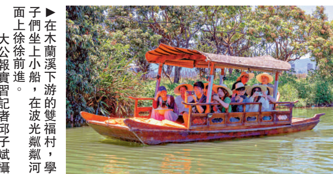
▲在木蘭溪下游的雙福村，學子們坐上小船，在波光粼粼的河面上徐徐前進。