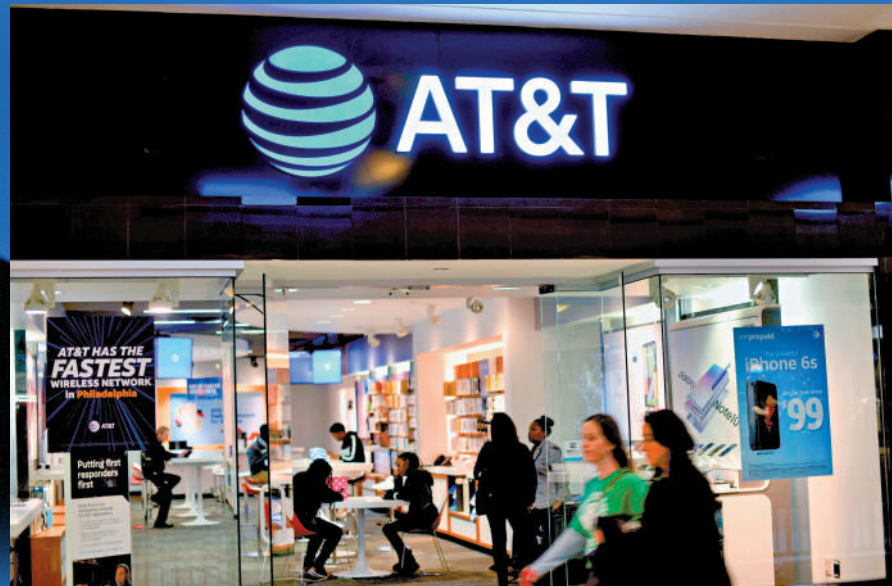
▲美國通訊商AT&T遭遇黑客入侵，逾億用戶受影響。