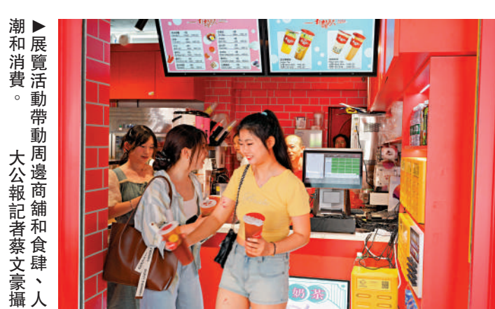
來自菲律賓旅行團的遊客到來參觀，感到十分興奮。展覽活動帶動周邊商舖和食肆、人潮和消費。