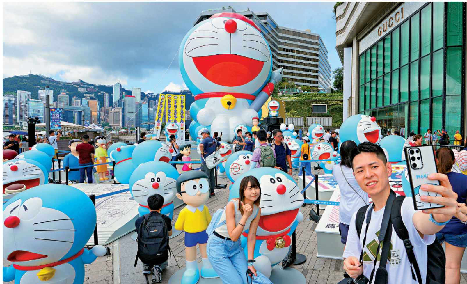
多啦A夢巡迴特別展覽昨日開鑼，市民與遊客在烈日下湧往星光大道一帶「打卡」，人氣財氣滿滿。