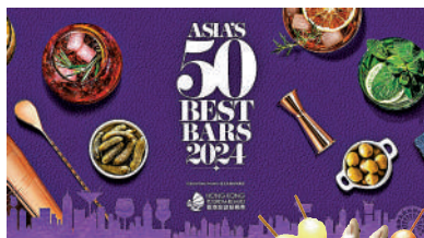
▲▼2024「亞洲50最佳酒吧」頒獎典禮明日舉行，環球頂尖調酒師獲邀來港，於香港多間酒吧擔任客席調酒師。

較早前於7月9日，活動主辦方已公布「亞洲50最佳酒吧」名單的第51至100名，旅發局亦於官方網站推出全新酒吧地圖，包括過去5年榮獲「亞洲50最佳酒吧」的本地酒吧位置及簡介，更設有特色雞尾酒推介，讓市民旅客好好認識各大得獎酒吧。旅發局與主辦方攜手為城中特色交通包括電車、帆船張保仔號換上新裝，又在部分熱點如中環半山扶手電梯、尖沙咀、中環海旁，及中環交易廣場附近行人天橋等加置海報及直幡，營造全城舉熱熱鬧氣氛。