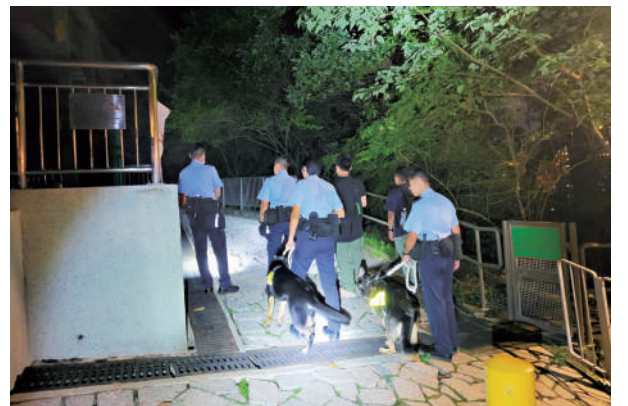
反爆竊行動。警方執行代號「鷹騰」的陸空

警方提醒市民，加強家居防盜措施，時刻鎖好門窗，避免將貴重財物或大量金錢擺放於單位內，以減少損失。如市民發現住所附近的山坡位置有可疑人，應立即致電999報警。