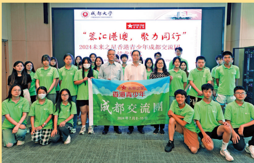
「蓉匯港澳 聚力同行」——「未來之星香港青少年成都交流團」14日圓滿結束。