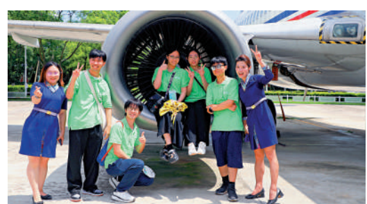
透過近距離接觸，港生仔細了解飛機的結構。

而參觀完與成都工廠融為一體的沃爾沃汽車品牌體驗中心後，港生們則真切感受到成都產業的發展脈動。大家乘上觀光車，深入沃爾沃成都工廠的衝壓、焊裝車間，感受先進製造工藝與高度智能化生產設備的融合。隨後，大