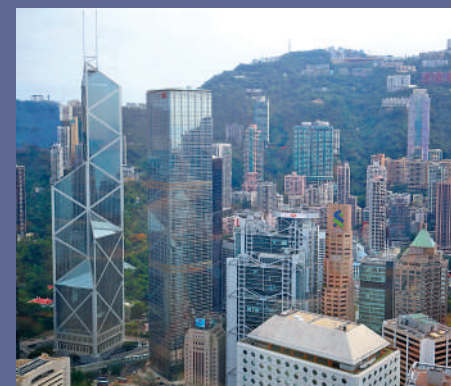
香港一直扮演著人民幣國際化的試驗場和前沿陣地角色。

東盟等的區域合作，建立互利共贏的交易及結算機制，支持人民幣在境內外市場有效循環，進一步推動人民幣國際化走深走實。」