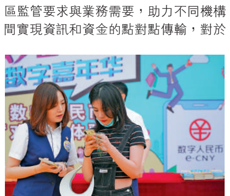
▲央行數碼貨幣發展是大勢所趨，數字人民幣站在領先前沿。

便提出了「無損、合規、互通」原則，創新引用了模塊化設計方案，充分尊重各國貨幣主權，並靈活適應各司法管轄區監管要求與業務需要，助力不同機構間實現資訊和資金的點對點傳輸，對於