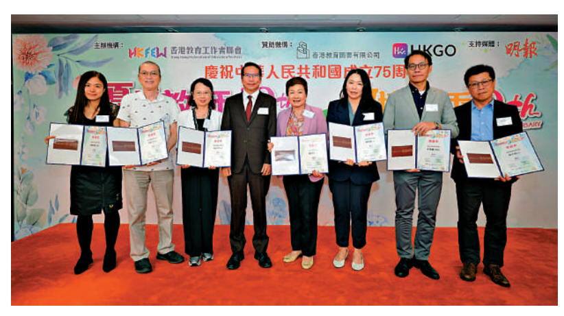
「優秀教師選舉暨教壇新秀2024」頒獎典禮昨日舉行，表揚優秀教師為教育界提供創新的教學點子。

多套國際物理競賽中使用過的儀器，是在外面的公司買不到的，是科大提供給競賽學生的額外資源。」 科大除了給競賽學生提供豐富的資源支持，在課程方面科大亦給在校學生提供眾多發展機會。張教授指出，科大的國際科研課程學生可以在四年的學習期間，參與由教授指導的前沿本科研究，並安排到頂尖海外大學進行暑期研究實習，更有機會赴歐洲核子研究組織（CERN）進行暑期實習。科大亦趕上人工智能的大趨勢，最近新增「物理+AI」理學士（物理）一延伸主修人工智能課程選項，讓同學學習如何將AI應用至物理專業。 文憑試放榜在即，科大加碼了入學獎學金計劃，透過JUPAS入讀並符合條件的新生，可獲逾10萬元獎學金，當中包括全額學費獎學金、海外學習獎學金及生活津貼等。