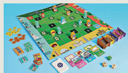
▲中電推出「低碳城市規劃師」桌上遊戲，可鍛煉邏輯思維。

可以加深小朋友的環保節能及低碳減廢知識，並融入編程元素，在規劃建構低碳城市過程中，訓練小朋友邏輯思維及解難能力。