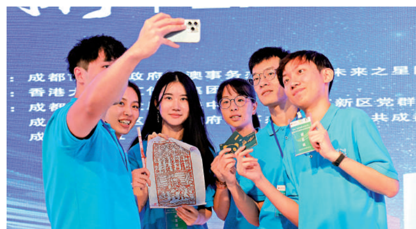
▲同學們獲贈小禮包，一起拍照留念。

略、小玩偶等。「這張紙幣非常有紀念意義！」「這個玩偶很萌，我好喜歡！」不少港青現場打開小禮包，紛紛自拍合影，欣喜之情溢於言表。