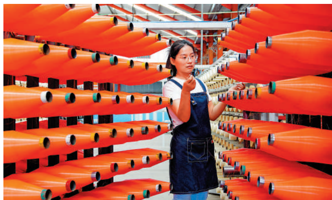
▲4月25日，在山東一繩網產業園，工作人員整理線軸。

統計局數據顯示，上半年國內生產總值，分產業看，第一產業增加值30660億元，同比增長3.5%；第二產業增加值236530億元，增長5.8%；第三產業增加值349646億元，增長4.6%。分季度看，一季度國內生產總值同比增長5.3%，二季度增長4.7%。從環比看，二季度國內生產總值增長0.7%。