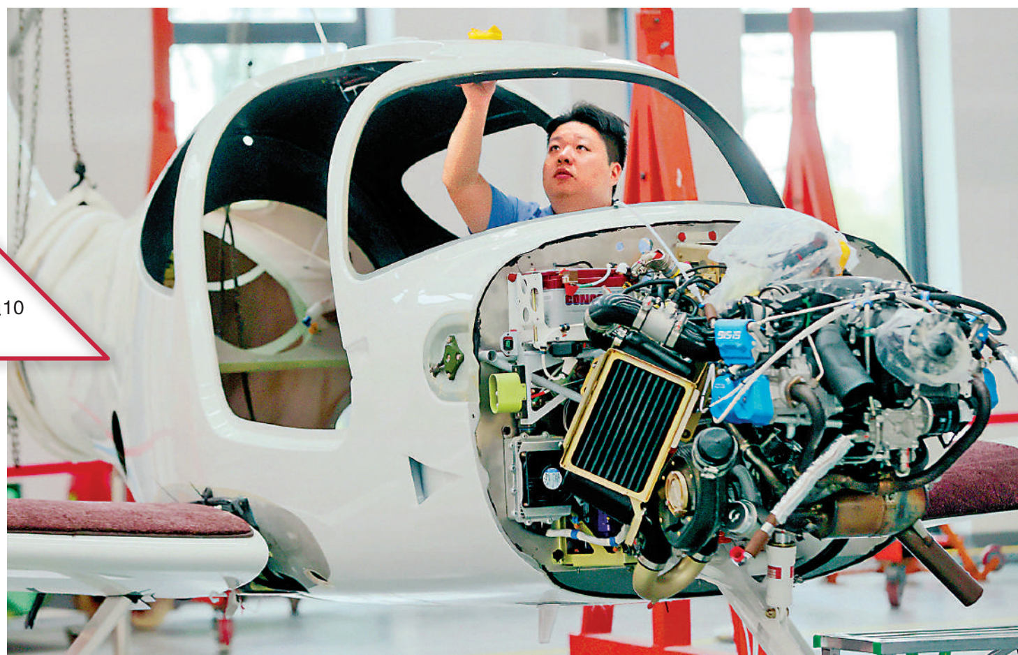
▲6月11日，在浙江省湖州市德清縣通航智造小鎮浙江中航通飛研究院有限公司車間，工作人員進行飛機鉚接作業。

發言人表示，展望下半年，外部環境不穩定性不確定性上升，國內困難挑戰依然不少，但是這些都是前進中的問題、成長中的煩惱，歸根結底要在推動發展中不斷加以解決，對於這些問題，有關部門有清醒的認識，已採取一系列措施加以解決。綜合來看，中國發展面臨的有利條件強於不利因素，穩中向好、長期向好的發展態勢不會改變。