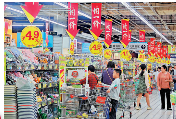
▲上半年，中國社會消費品零售總額同比增長3.7%。圖為福州市民在超市購物。