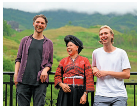
▲6月26日，廣西龍勝大寨村村民在她家民宿外和兩位德國遊客交流。

【大公報訊】記者趙一存北京報道：國家移民管理局15日發布公告，新增鄭州新鄭國際機場、麗江三義國際機場和磨憨鐵路口岸3個口岸為144小時過境免簽政策適用口岸。至此，中國144小時過境免簽政策適用口岸增至37個。