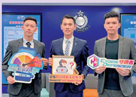
▲警方提醒市民慎防騙徒。

警方交代騙徒犯案手法表示，騙徒會按照事主使用的語言及電話號碼等，在各個網站投放「彈出式頁面」的廣告，該廣告會以全螢幕形式顯示，例如Windows的「藍Mon」故障畫面，令用家誤以為無法操作電腦。該廣告同時會播放錄音，要求用家不要關機，並致電假冒的技術人員。