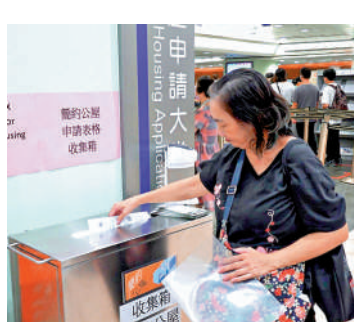
樂富的房委會客務中心，有簡約公屋申請者交表。

首批簡約公屋共提供約4400個單位，分別位於元朗攸樂路及牛頭角興路，租金介乎740至2650元。簡約公屋申請人須為輪候傳統公屋3年或以上，以家庭申請為優先，如居於不適切居所較長時間、家中有長者或子女等可獲額外加分。首批獲編配單位的申請者今年第四季起，會陸續收到房屋局的通知，作進一步資格核實和相關入住安排。