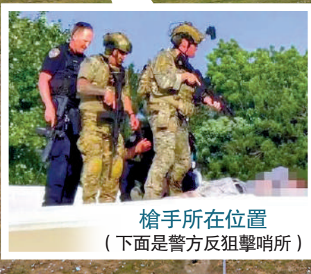
槍手所在位置 (下面是警方反狙擊哨所)