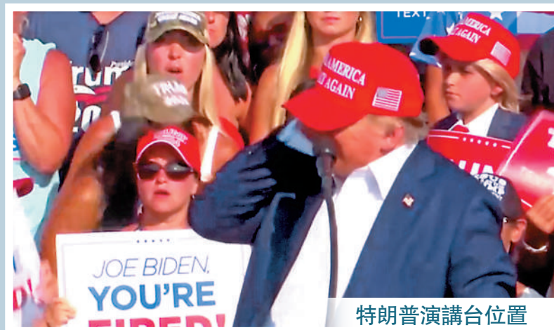
特朗普演講台位置