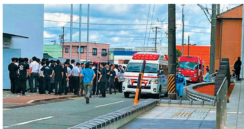
▲消防車停靠在日本愛知縣高濱市的政府辦公樓外。

泰國總理賽塔下令徹查案件，以防止對民眾及旅遊業造成影響，並在晚上9點抵達現場視察。泰國政府從15日起延長93個國家和地區的遊客、商務人士和短期工作者免簽入境停留時間，單次停留不超過60日，此前為30日。