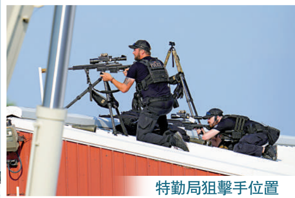
特勤局狙擊手位置