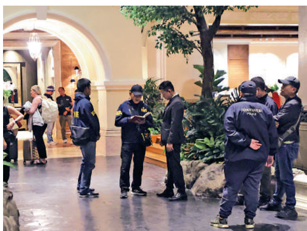
▲泰國警方16日在曼谷愛侶灣君悅酒店調查案件。