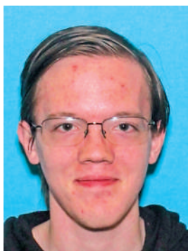
▲槍手克魯克斯。

【大公報訊】在競選活動開始前，特勤局會例行檢查附近的企業和建築，並與當地執法部門合作，監控安全警戒線以外的建築以確保沒有安全風險。特勤局發言人表示，特朗普的集會現場部署了四支反狙擊小組，其中兩支來自特勤局，另外兩支來自當地執法部門。