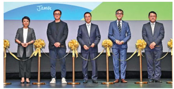
▲「滄海一聲笑——黃霑」展覽開幕禮昨舉行。

展覽開幕儀式於昨日舉行。文化體育及旅遊局局長楊潤雄致辭時表示，今年正是霑叔逝世20周年，這次的展覽，回顧霑叔的創作歷程，細味他筆