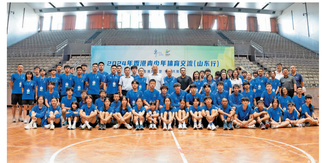
▲七十多位香港中小學生參加交流團。

交流團將走進濟南、濰博、青島的體育學校和體育機構，透過與當地學生一起訓練和比賽，在提高技術提升經驗的同時，增強香港學生對內地體育的認識和對國家的認知。貝鈞奇表示，除了訓練和比賽外，交流團還會參觀濟南天下第一泉、濰博古齊國文化特色區，以及青島奧帆基地等，親身感受厚重的中華文化。