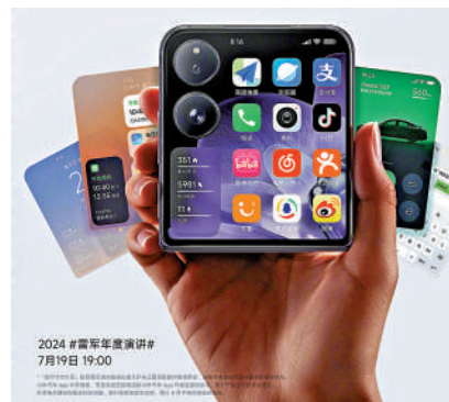
▲小米小摺疊屏手機MIX Flip採用上下翻摺式設計。

雷軍在微博發帖文指，很多人問他，小米的小摺疊屏手機為什麼這麼晚才推出，他表示，小米早於5年前開始規劃，3年前已就MIX Flip立項，但小摺疊機的體驗要做好並不容易，當時下定決心，幹好後才發布。他又指，MIX Flip是小摺疊機中的旗艦機，是一台超好用的手手機。雷軍更發布一段短視頻，安排小米工業設計部總經理魏旭講解MIX Flip的發展來龍去脈，片段中有MIX Flip正式推出前的三代產品設計，惟每一代產品均有不同的痛點，例如女生拿到摺疊屏手機難以自拍，部分設計亦未有實際價值，因而遭雷軍拒絕。如今，即將於本周五發布的MIX Flip，已經是第四代的設計，亦獲得雷軍讚好。