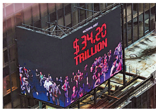
▲美國債務問題嚴重，所以高息會令其面對沉重的償還壓力。

筆者所知，許多美國民眾對於高息感到吃力，尤其是部分高達7厘的按揭息率令他們感到左支右絀，希望減息快些來臨。鮑威爾表示，聯儲局在通脹方面取得了相當大進展，是美國歷史最悠久的消息。美國大選年經濟會比較好，翌年就會走樣，需要用減息扶持，料資本市場就會有較佳表現。