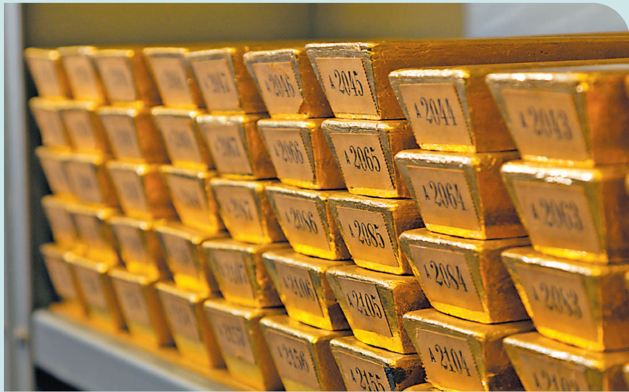
▲黃金具備避險屬性，所以每當地緣政治風險上升，市場對黃金的需求都會增加，從而為金價帶來支持。

近期黃金盤中一度突破每盎司2480美元，創出新高。在「降息」與「特朗普2.0」這兩個互相矛盾的交易邏輯影響下，黃金價格表現優異，再度凸顯其「進可攻、退可守、長期有空間」的優良配置屬性。