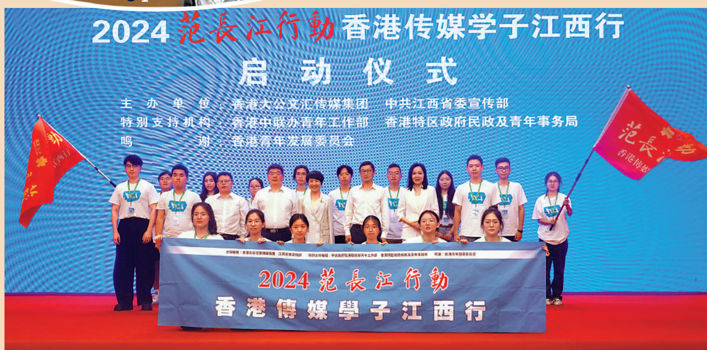
▲7月18日，「2024范長江行動——香港傳媒學子江西行」在南昌啟動。與會嘉賓與「2024范長江行動——香港傳媒學子江西行」採訪團成員合影。