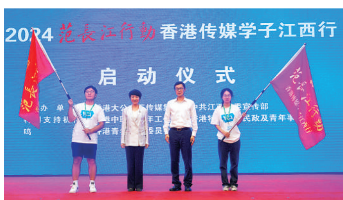
▲江西省委常委、省委宣傳部部長盧小青（左二），「2024范長江行動——香港傳媒學子江西行」採訪團團長、香港大公文匯傳媒集團副董事長王凱波（左三）向贛港學生代表授旗。

盧小青說，香港大公文匯傳媒集團是愛國愛港全媒體傳媒旗艦，歷史悠久、影響巨大。多年來，集團充分發揮自身優勢，致力於對外講好江西故事，傳播江西聲音，為深化贛港交流合作發揮了重要作用。去年7月，我們共同舉辦首屆「范長江行動——香港傳媒學子江西行」，亮點頻出、熱度不斷。今年，我們再啟新程、接續精彩，圍繞紅色基因傳承、生態文旅、鄉村振興、新質生產力等主題開展實地採訪。希望同學們爭當贛港友誼的見證者與傳承者，深