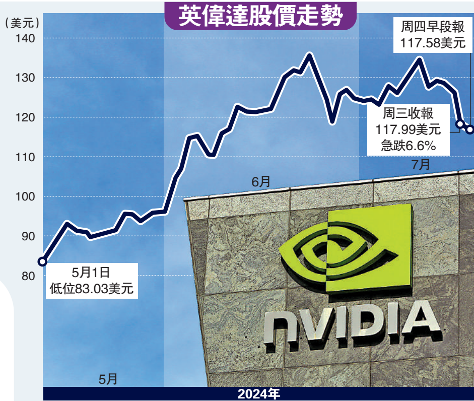
▲英偉達股價近日急挫，分析預測仍有下跌空間。

事實上，英偉達創辦人兼行政總裁黃仁勳近期不斷趁高位減持，美國證券交易委員會文件顯示，黃仁勳6月減持英偉達130萬股，套現近1.69億美元，為他個人單月拋售最高紀錄。他於7月繼續減持行動，包括7月5至8日，共出售價值3070萬美元的英偉達股票；7月15至16日再放售價值3060萬美元的英偉達股票，平均價在126.34至130.34美元。不足兩個月，合計套現2.3億美元 (約17.9億港元)。目前，黃仁勳仍持有英偉達約7870萬股。