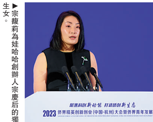
生女宗馥莉為娃哈哈創辦宗慶后的獨生女。