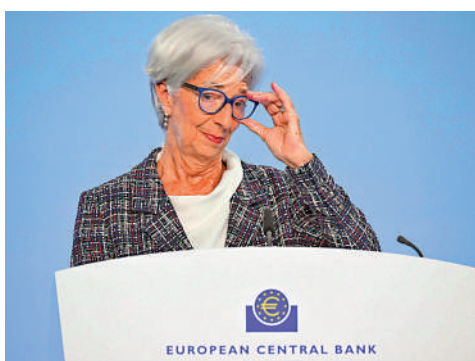
▲歐央行總裁拉加德表示，對9月減息和央行行動持非常開放的態度。