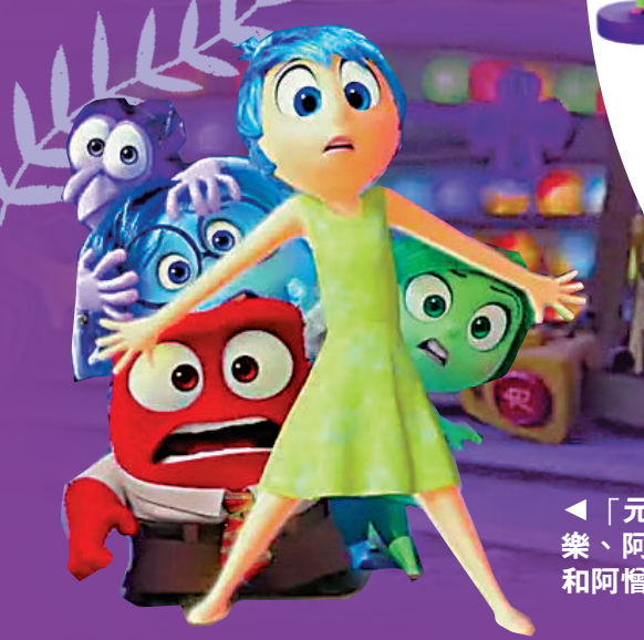
▲「元老腦朋友」阿樂、阿愁、阿驚、阿燥和阿憎遇到挑戰。