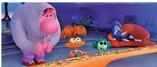
▲全新的「腦朋友」阿焦、阿羨、阿厭、阿尷尬登場。

縱觀全片，編劇一直秉承「寓言化」的理念，將故事放在首位，對道理的講述則非常克制。第二部主要刻畫的「腦朋友」阿焦雖然在劇情的部分時間都處於「反派」位置，不斷控制着韋莉的大腦做出錯誤的決定，但它的每一個行動在發生的當下都有着十分合理的動機，而當韋莉出現「我不夠好」的自我意識，阿焦的失落和倉皇也讓觀眾體會到它並非一個控制欲超強的野心家，只是將自己的努力用錯了地方。因此，在影片之外觀眾也會自然地領悟出情緒並非好壞，應該自然面對的道理。同時，在如何處理焦慮的問題上，編劇也並未從「人類」的角度給出答案，而是用阿樂為阿焦準備按摩椅的情節簡單處理，最終形成韋莉自我意識的核心記憶因為一系列的陰差陽錯並非來自「腦朋友」的努力篩選，其間深意留給銀幕外的觀眾自己領會。這些留白既可引發觀眾們獨立的思考，也為帶娃觀影的家長提供親子交流的契機。而幻想空間、頭腦風暴、意識流等充滿想像和創意的心理學概念具象化場景也能夠激發小觀眾們了解、認識心理學的興趣。