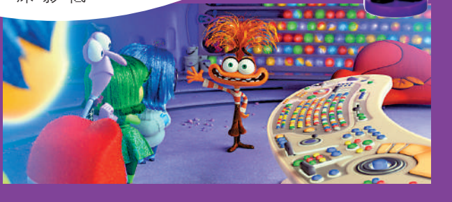
▲阿焦主宰韋莉的情緒。

近年，隨着動畫電影在全球的熱度飆升，經歷併入迪士尼、成員大換血後彼思工作室作品的連續折戟曾一度讓喜愛他們的影迷捏了一把汗，但今次《玩轉腦朋友2》的精彩表現證明彼思工作室在做出轉變發力方向後製作水準的全方位回歸，期待今後他們可以用充滿想像和創意的寓言童話視角為我們講述更多關於嚴肅主題的獨特故事。