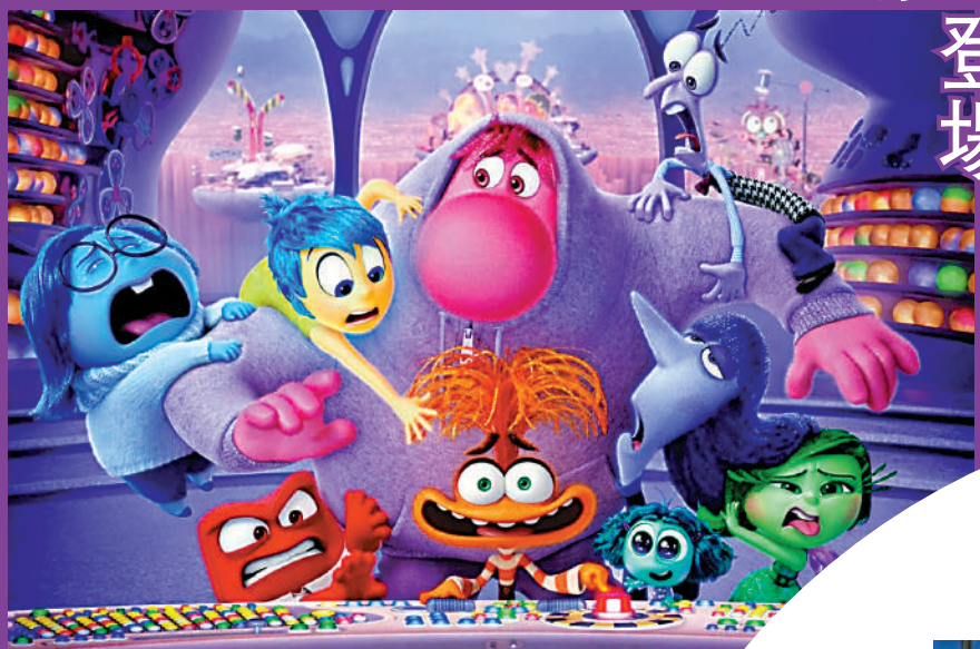
▲《玩轉腦朋友2》正在香港上映。