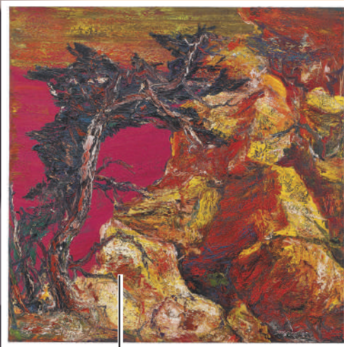
▲《黑松》布面油畫 300x300cm 2013年。