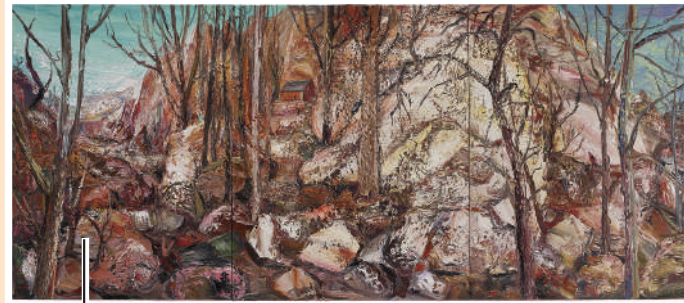
▲《晴巒秋寺》布面油畫 180x450cm 2013年。