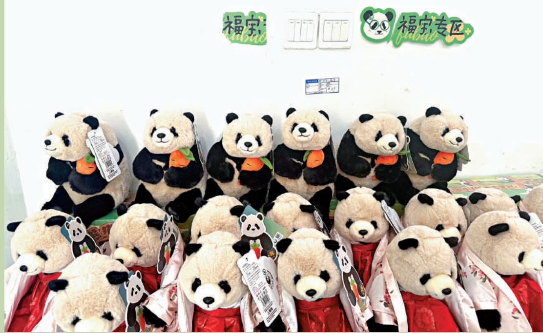
▲「福寶」人氣高漲，帶動相關文創產品熱賣。