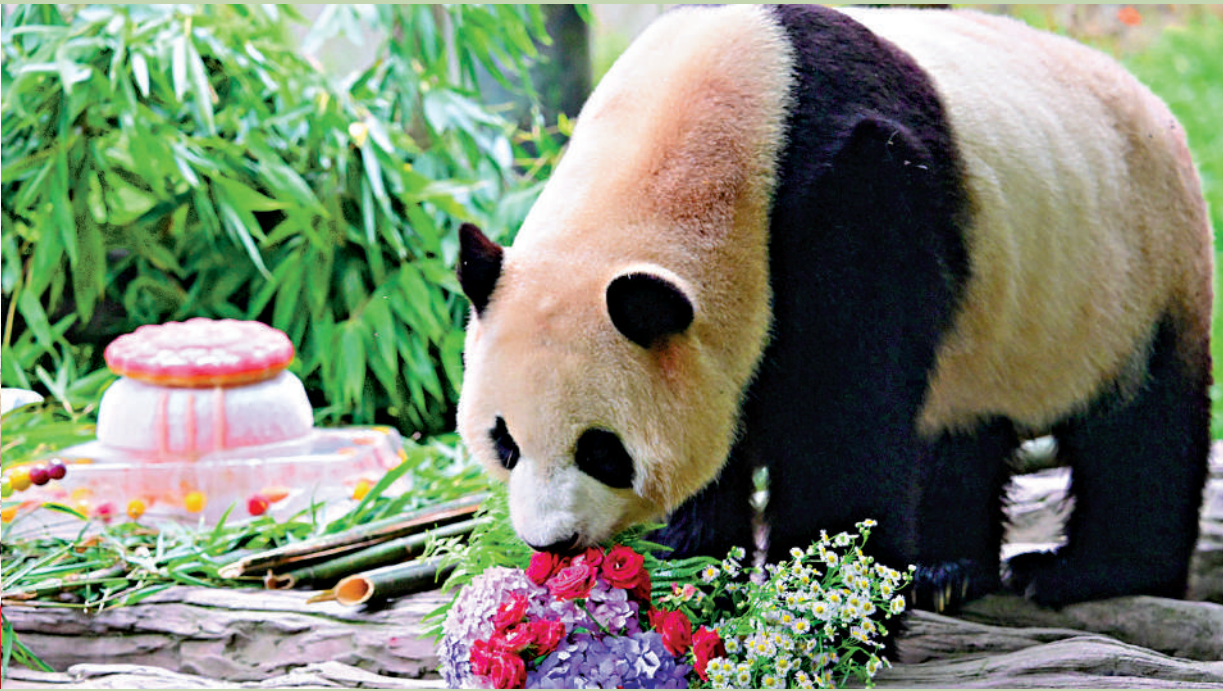
▲「福寶」已適應家鄉的生活，呈現出很自在的狀態。