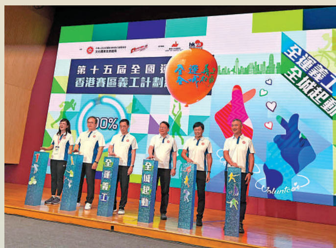
▲陳國基（右三）與楊潤雄（右四）主持啟動禮儀式。

今次義工計劃報名截止日期為9月20日。參與計劃的香港市民，將有機會在不同崗位提供義務工作，例如嘉賓和運動員接待、觀眾服務、傳媒中心支援、活動和場地支援、行政工作、後勤服務。