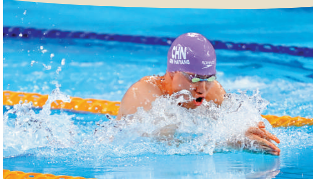
▲覃海洋目前是史上首人單屆世錦賽包攬50、100及200米蛙泳金牌。

據中新網報道：7月27日至8月4日，巴黎奧運會游泳比賽將在拉德芳斯體育館產生35枚金牌。近年來憑藉出色表現令人充滿期待的中國泳軍將迎來屬於奧運賽場的「成色」檢驗。此次中國游泳隊的名單覆蓋經驗值不同的各年齡段優秀選手，實可謂精英盡出，他們中，既有汪順、徐嘉余等實力老將，張雨霏、覃海洋等中堅力量，也有潘展樂、唐錢婷等後起之秀。對於這支被稱為「黃金一代」的中國游泳軍團，巴黎賽場將是一次充滿挑戰的追求綻放之旅。