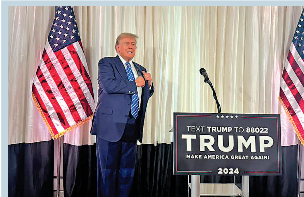
▲6月6日，特朗普在加州三藩市出席競選籌款活動，據稱籌款1200萬美元。