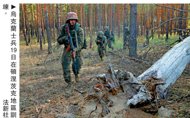
線▶烏克蘭士兵19日在頓涅茨克地區訓練。

特朗普曾數次表示，他會迅速結束這場衝突，但沒有提供詳細做法。不過他去年接受訪問時表示，烏克蘭可能必須放棄一些領土，才能達成和平協議。特朗普的競選搭檔、俄亥俄州參議員JD萬斯，是國會內部主張美國停止軍援烏克蘭的強硬派。