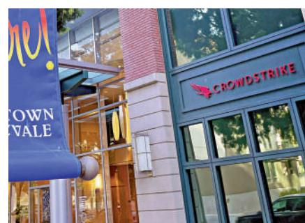
▲CrowdStrike位於加州森尼韋爾的辦公室外。

困難。英國工程技術學會專家伊恩·科登指出，為了減輕網絡故障的影響，企業應裝有備份系統、定期進行災難恢復測試並制定嚴格的軟件更新協議。此外，企業還應使用先進的監測工具，就應對死機等突發情況進行IT人員培訓，並與第三方供應商密切合作，以確保制定有力的安全策略等。