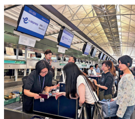
▲香港國際機場運作20日已恢復正常。

【大公報訊】記者伍軒沛報道：微軟系統19日全球出現大規模技術故障，本港航空公司的旅客登記系統也受影響，至少有5間航空公司需改用人手辦理登機手續，約有10多個航班延誤。機場管理局20日表示，受影響的航空公司旅客登記系統已回復正常，香港國際機場運作全面恢復正常。政務司司長陳國基表示，當局已與微軟溝通，