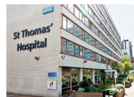
▲倫敦聖托馬斯醫院在6月Synnovis遭黑客攻擊事件中受到影響。

敦多家醫院和診所無法與Synnovis的伺服器安全連線，蓋伊和聖托馬斯國民保健信託基金、國王學院醫院國民保健信託基金旗下的7家醫院，以及倫敦東南部的初級保健服務都受到嚴重影響，不得不取消或推遲800多已預約的手術和700項門診。受影響的病患包括需要接受癌症治療和器官移植的病人。