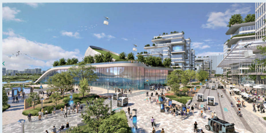
城規會已通過新田科技城的三張相關分區計劃大綱草圖。