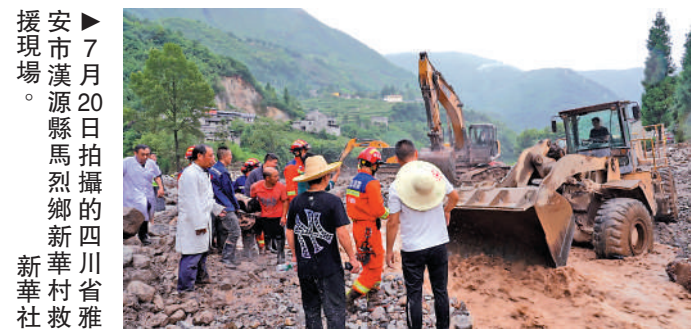
▲7月20日，雅安漢源縣馬烈鄉新華村發生山洪災害，救援人員在現場開展救援工作。

財政部要求有關省（市）財政廳（局）抓緊將資金撥付災區，及時了解掌握災區應急救災資金安排和資金需求，採取措施全力保障；切實加強救災資金監管，堅決杜絕資金滯留、擠佔、挪用等違規行為，確保救災資金全部用於災區和受災群眾。