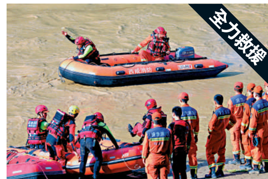
▲救援人員在橋樑垮塌現場進行搜救工作。