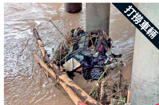
▲救援人員在橋樑垮塌地附近發現的墜河汽車。