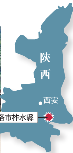
▲19日20時40分左右，陝西商洛柞水縣境內突發暴雨山洪，導致丹寧高速公路水陽段山陽方向K46+200處嚴坪村二號橋局部垮塌。