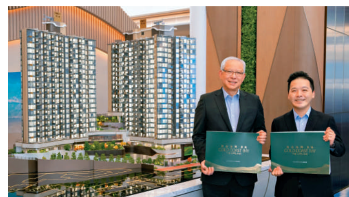
▲旭日國際公布黃金海灣，意嵐第3批單位售價，平均呎價較首批貴逾12%。