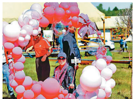
▲隨着老年人口的不斷增加，鄉村旅居有望佔據旅居康養主體。