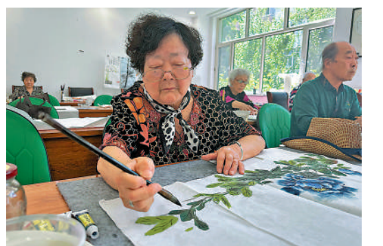
▲在老年大學，老人能學到小時想學而沒學到的課程。

民辦幼兒園的數量早在2020年便開始下降，3年來已減少了7467所。在哈爾濱市，入