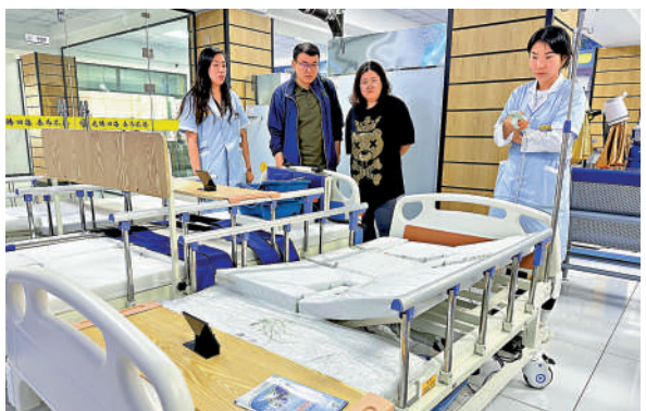
▲電動智能護理床、多功能電動輪椅近年來受到消費者青睞。

家養老、輔助器的設備；還與一些傳統零售企業在商討，針對老年人推出健康食品、保健品等商品。