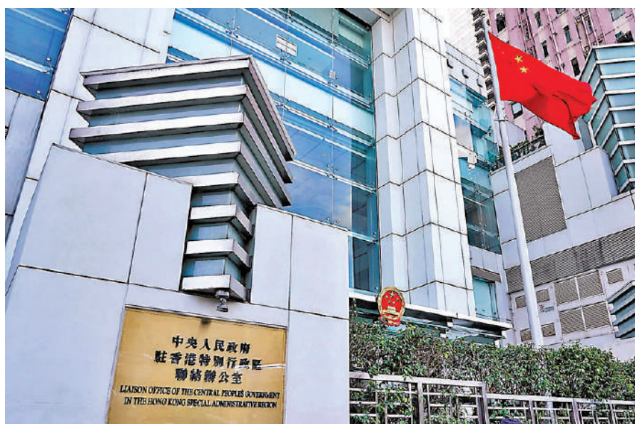
▲7月22日，中央政府駐港聯絡辦召開領導班子會議，傳達學習習近平總書記在黨的二十屆三中全會上的重要講話精神和全會精神。

【大公報訊】7月22日，中央政府駐港聯絡辦召開領導班子會議，傳達學習習近平總書記在黨的二十屆三中全會上的重要講話精神和全會精神，結合學習貫徹習近平總書記關於港澳工作的重要論述、重要指示批示精神，抓好全會精神的學習宣傳貫徹工作，支持香港特區在進一步全面深化改革、推進中國式現代化中更好發揮作用，推動全會精神入腦入心，形成更多貫徹落實的實招硬招，以實幹業績檢驗學習貫徹成效。中央政府駐港聯絡辦主任鄭雁雄主持會議並致辭。