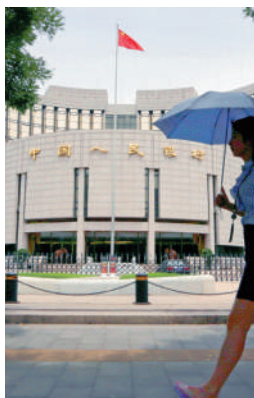
人行日前推降息「組合拳」，支持經濟發展。